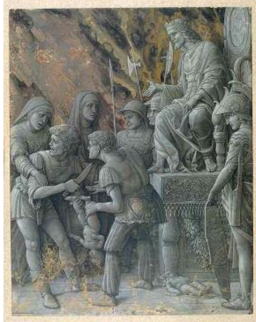
ئەندریا مانتینا Andera Mantegna

هونەری ئەوروپی سەدە گانی ناوەراستی و پێنسانس ٢٧١